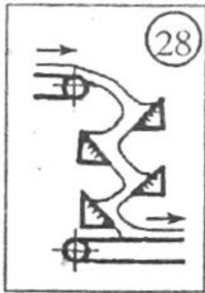
Рис. 1. Схема просеивания с каскадным расположением просеивающих поверхностей